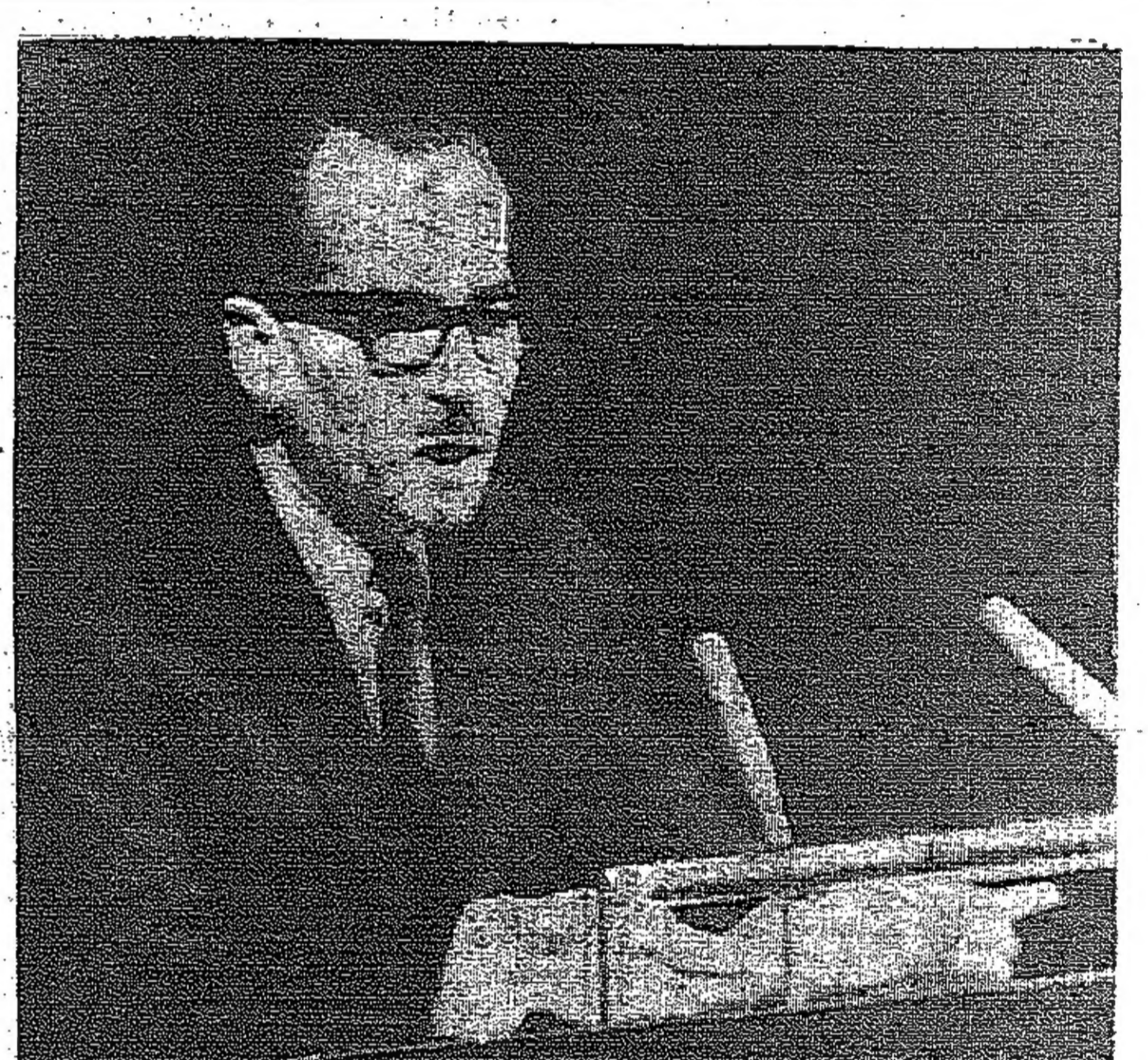
السيد عبد النعم الرفاعي وزير الخارجية الأردنية يلقي كلمة في الجمعية العمومية للأمم المتحدة

محاكمة المناضلة عملة طه واجهت قضاياها كاتراً تواجها تلازمها كتبت الصحف اليهودية تقول : تجري هذه المحاكمة عملة طه عريضة شامة ، فطلعت استخدام اقام الوقت ، على اقام الكاتبة - كما قال صحفي اسرائيلي - في مدينة نابلس وهذه العملة هي عيلة شقيق طه . وقد اثار هذا المحاكمة التي تجري امام محكمة عسكرية اهتماما كبيرا في اوساط الصحافة العالمية ، واهتم عدد كبير من رجال الصحافة وممسوري السبنا والفقراءون بما يجري في قاعة المحكمة بعد ان احوال برارة على السباح لهم بحضور المحكمة . وقال احد الصحفيين المصورين : طلت العملة على ايام قاعة المحكمة ، بشكل طبيعي وكاتبة تدخل قاعة المحكمة ، كانت عالية المنويات مرفوعة الرأس منتصبة القامة رغم انها حامل ، وهي متوجهة منذ نصف سنة في شاب عربي من القدس يعمل في مؤسسة خيرية . وكانت قد اقتضت على جسر القتيبي قبل حوالي شهرين حينما عن رجال الجمارك في طبقة سرية داخل حقلها ، على مفود متفجرة مختلفة مثل اقدم التوقيت ونشورات التحريض الصادرة عن الجبهة الشعبية لتحرير فلسطين . وادى اكتشافها الى الفاء القضي على مملتين اخريين ، من زميلاتها ، بالإضافة الى عدد من المقيمين الاخرين . ورئيس المحكمة العسكرية الاسرائيلية التي تتالف من ثلاثة قضاة عسكريين ضابط برتبة رائد يدعى : بي زهايه . ويحمل الادعاء العام الحامي ليند نظراوس .